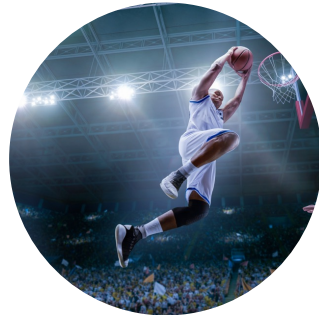
5-7 muuta urheilutapahtumaa (kuin TPS)