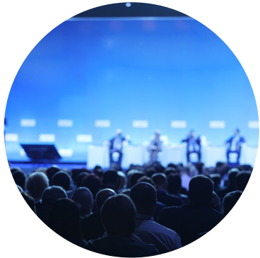
8-12 messu- ja yritystapahtumaa