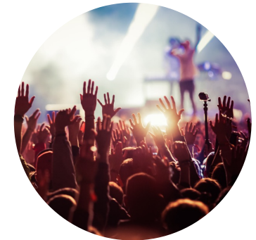
6-8 ulkomaista konserttia