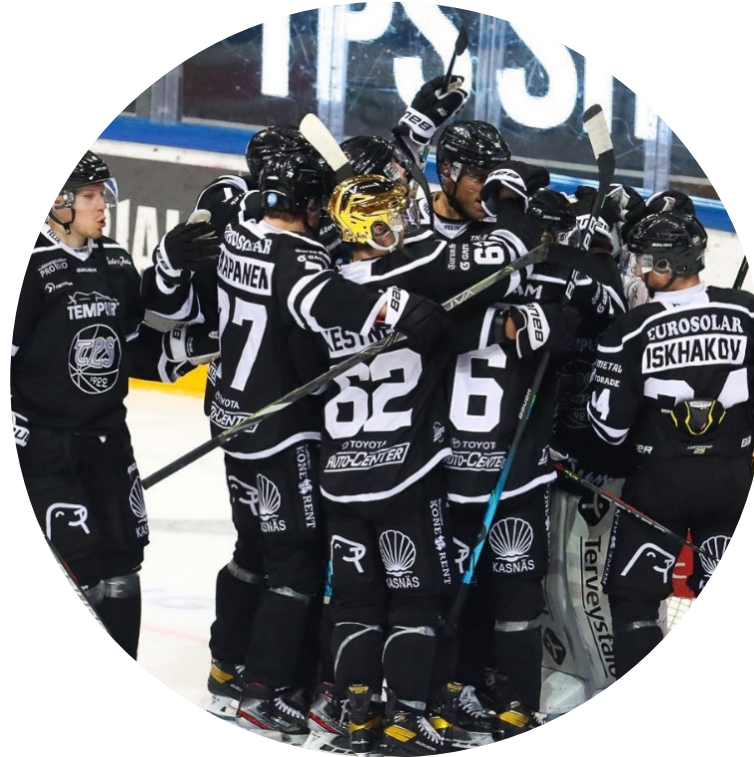
35-40 TPS:n peliä