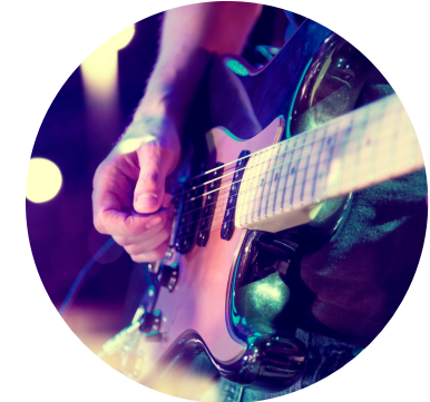
7-10 kotimaista konserttia